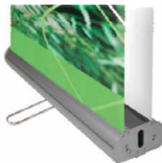
Pied stabilisateur central

Le kit comprend : le carter, les rails supérieurs clippants, le mât à élastique en 3 parties et le sac de transport.