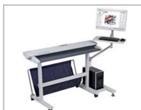
Scanner sur Pied classique avec réceptacle et option support PC / Ecran