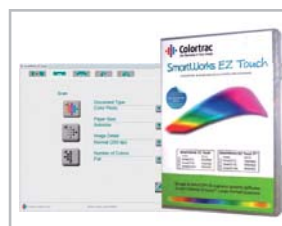
Logiciel SmartWorks Touch