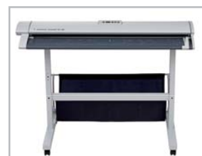
Scanner sur Pied classique avec réceptacle.