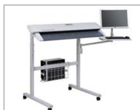
Scanner sur Pied Repro