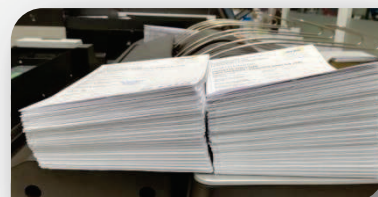
La meilleure précision de pliage