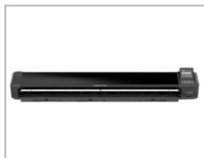
Scanner SmartLF Scan! - face