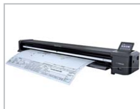
Scanner SmartLF Scan!36