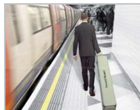
Caisse de transport à roulettes