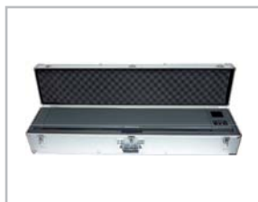
Caisse de transport renforcée