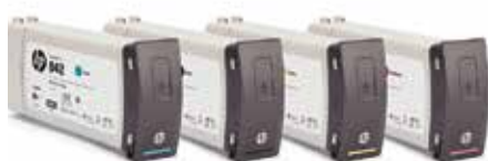
8 cartouches (2 x 775 ml par couleur avec changement automatique)

L'imprimante HP PageWide XL 8000 inclut une barre d'impression fixe de 101,6 cm (40 pouces) qui couvre toute la largeur d'impression. Au fur et à mesure que le papier avance sous la barre d'impression, toute la page est imprimée en une seule passe, permettant ainsi des vitesses d'impression très élevées.